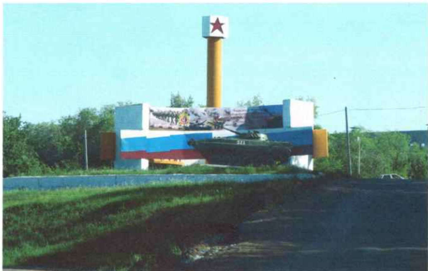
Стелла на въезде в военный городок